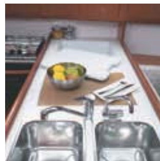
Double évier • Double sink • Doppio lavello • Fregadero doble seno • Doppelspüle