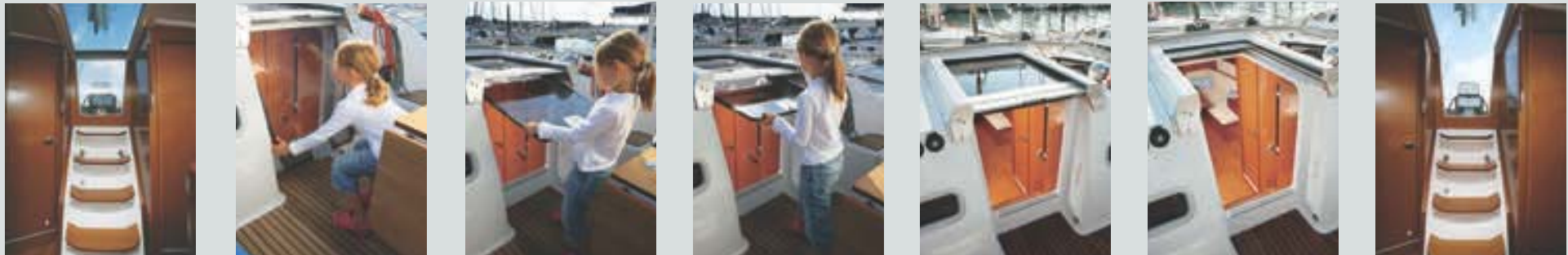
Exclusivité BENETEAU : nouveau système de porte de descente • BENETEAU Exclusive – new companionway door system • Esclusiva BENETEAU : nuovo sistema porte discesa • Exclusividad BENETEAU: nuevo sistema de puertas de entrada • Exklusiv bei BENETEAU: ein neues System für Niedergangstüren