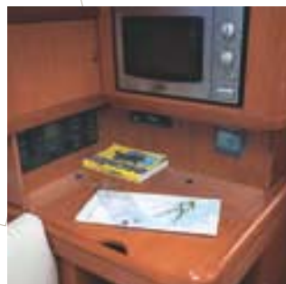
Micro-ondes (option) • Microwave (option) • Micro-onde (opzione) • Horno microondas (opcional) • Mikrowellenherd (Option)