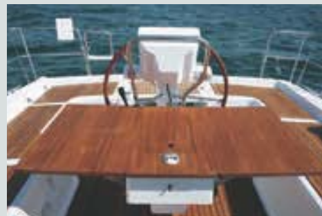
Table de cockpit avec éclairage (option) • Cockpit table with lighting (option) • Tavolo di pozzetto con illuminazione • Mesa de bañera con iluminación • Cockpittisch mit Beleuchtung