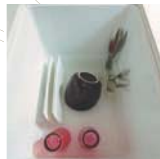
Bac de rangement de la vaisselle courante avec égouttoir (dans la version Exclusive) • Sliding crockery storage container with drainer • Contenitore per stoviglie con scolapiatti • Cubeta de estiba vajilla diaria con escurridor • Becken für Gebrauchsgeschirr, mit Geschirrständer