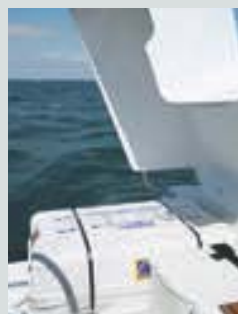
Coffre à BIB et à gaz avec vérin à gaz en inox • Liferaft stowage locker • Gavone per zattera • Cofre balsa salvavidas • Stauraum für die Rettungsinsel