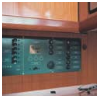
Tableau de commandes • Control panel • Quadro comandi • Cuadro de mandos • Steuerpult