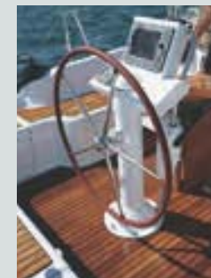
Console de barre à roue à écran électronique (option) • Helm position steering console with electronic display (option) • Console timone a ruota con schermo per elettronica (opzione) • Consola rueda de timón con pantalla electrónica (opcional) • Ruderkonsole mit elektronischem Display (optional)