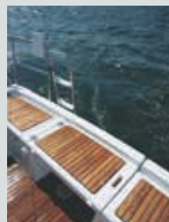
Banc barreur pivotant avec vérin à gaz en inox • Swivelling helm'sman's bench • Seduta timoniere girevole • Asiento skipper pivotante • Schwenkbare Rudergängerbank