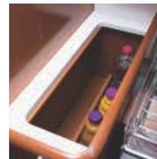
Rangement à bouteilles • Bottle stowage • Porta-bottiglie • Estibas botellas • Staufach für Flaschen