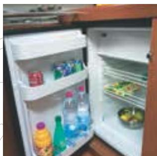
Réfrigérateur porte frontale • Front opening fridge • Frigorifero porta frontale • Refrigerador con puerta frontal • Kühlschrank mit Frontbeschickung