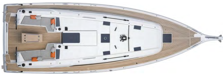
Ausführung mit 2 Kabinen 1 Badezimmer